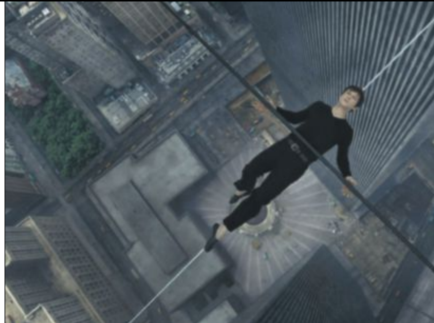
Joseph Gordon-Levitt som franskmannen Philippe Petit som gjorde dette vågestykket i 1974.