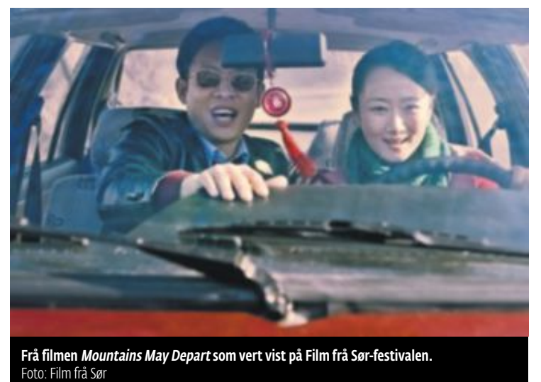
Frå filmen Mountains May Depart som vert vist på Film frå Sør-festivalen.

Tilfellet vil at den thailandske filmen også er ein del av hovudprogrammet under Film frå Sør og har første framsyning i morgon.