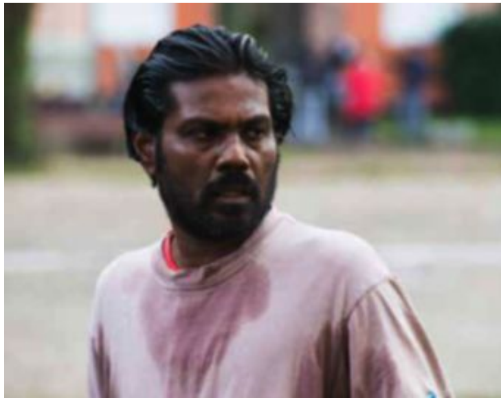
GULLPALME: Deephan handler om en soldat fra separatistbevegelsen Tamiltigreene som vil starte livet på nytt, og vant Gullpalmen i Cannes.