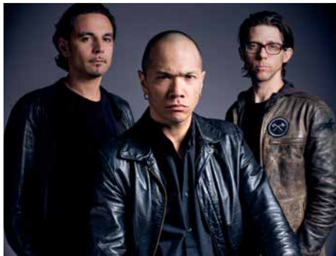
Danko Jones både ser og hører du på Rockefeller denne helgen.