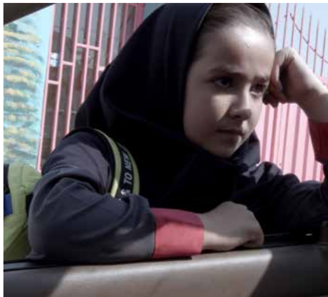
Taxi Teheran er en av filmene du ser på årets Film fra Sør.

Hvor: Revolver, Vulkan Arena og Pokalen Når: Torsdag-lørdag, dørene åpner kl. 20