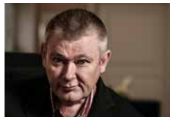
Thorvald Steen er en av gjestene på Oslo Internasjonale poesifestival.