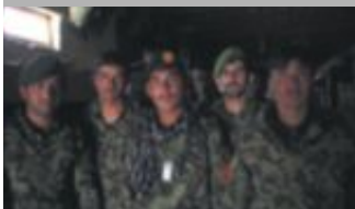
Filmen om krigen i Afghanistan er sedd med lokale soldatars augo.